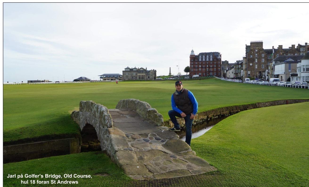
Jarl på Golfer's Bridge, Old Course, hul 18 foran St Andrews